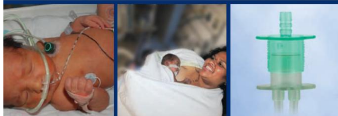
Komfortowe dla pacjenta